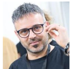
Gagli Immu (http